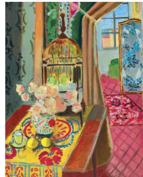
Εσωτερικός χώρος - εσωτερικός κόσμος : έργα του Ανρί Ματίς, (1869-1954) πρόκληση για αποτύπωση της δικής μας " απομόνωσης;"(2020)